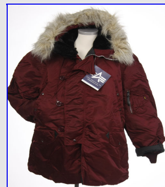
Parka N-3B Vintage Made in USA